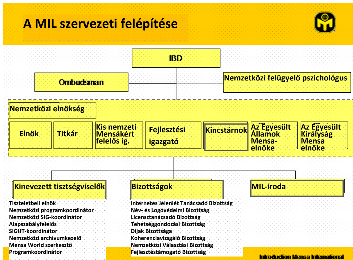
2. ábra: A Mensa International belső szervezeti felépítése

A nemzetközi Mensa-szervezetet az IBD irányítja. Az elnökség (ExComm), amely az öt nemzetközi szinten megválasztott tagon kívül az IBD-ben legalább 3 szavazattal rendelkező nemzeti Mensák (jelenleg csak az Egyesült Királyság és az Egyesült Államok, bár Németországban már kb. 7400 tag van, és ez a szám gyorsan nő) elnökeit is magában foglalja. A nemzetközi elnökség tehát 7 főből áll.